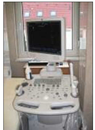
Ultrahang készülék a járóbeteg szakrendelőbe. Az önkormányzat vásárolta, 6,5 millió forintba került

meg. Szeretnénk, ha végre a 21. század elvárásainak megfelelő körülmények között tudnánk Önöket fogadni és ügyüket intézni. 2010. évi legnagyobb feladatunk ez lesz. Emellett a program többi elemét is meg akarjuk valósítani. A Fő és a Rákóczi utca felújítására futja most ebből a támogatásból, reméljük, ezzel példát mutatunk a tulajdonos államnak, hogy hogyan kell, kellene az adóforintjainkból azokat az utakat karbantartani, amiket használunk. Véleményem szerint nagyon fontos, hogy a piac is végre megfelelő és állandó helyet kapjon, hogy hosszú távon lehessen ott kereskedni, vásárolni és eladni.