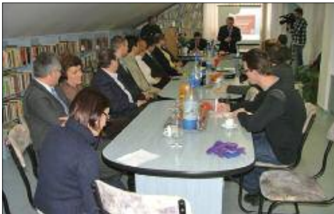
Tájékoztató a járóbeteg szakrendelőről a környező önkormányzatok polgármestereinek és házi orvosainak