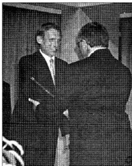
Pintér Sándor belügyminiszter és...