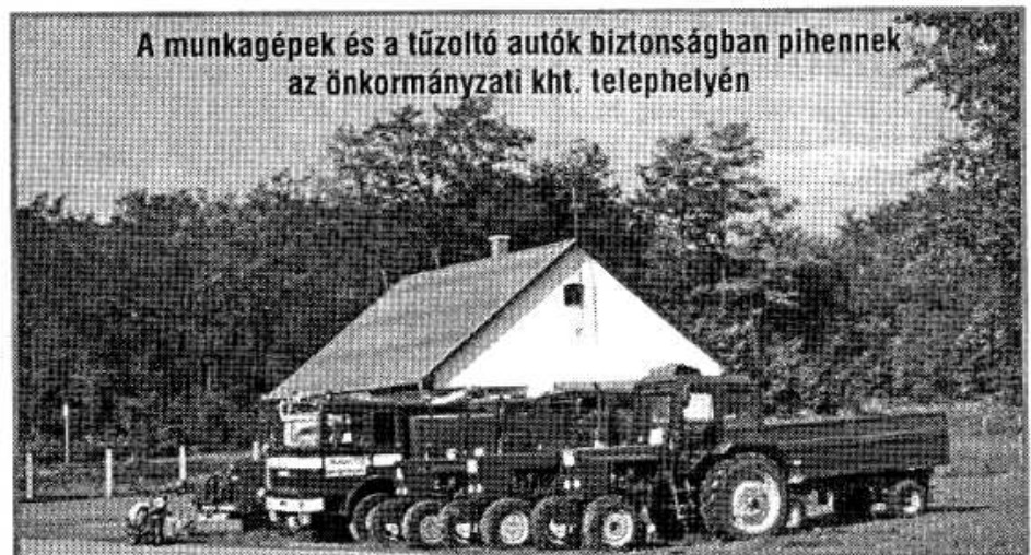
A munkagépek és a tűzoltó autók biztonságban pihennek az önkormányzati kht. telephelyén