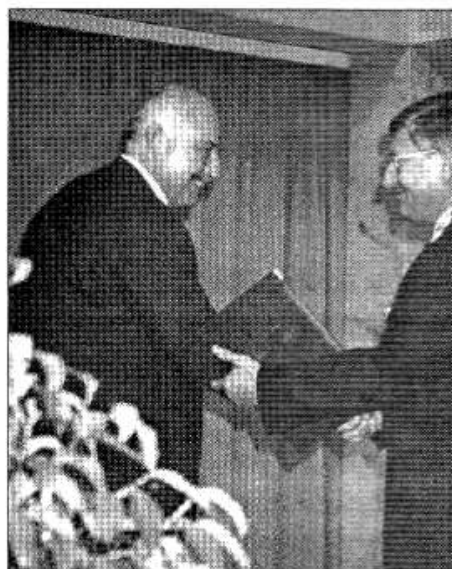
Martonyi János külügyminiszter is gratulált

A magánéletéről szólva elmondta: igazán örült, hogy különleges meghívott vendégként felesége és két gyermeke is ott lehetett az ünnepségen. Ilyen