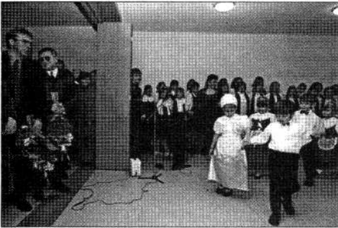
Az óvodások műsorral készültek az avatásra

gyermek nevelésébe befektetni egyet jelent az ország jövőjébe befektetéssel, ami a döntéshozók bizalmának is a jele. Kívánom, érezzék jól magukat a gyermekek ebben a csodálatos épületben, az óvónőknek pedig jó munkát, szeretettel óvják, gondozzák, neveljék a gyermekeket.