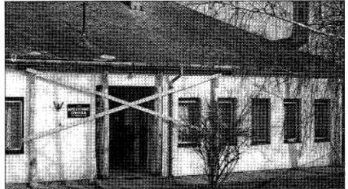
A régi, életveszélyes óvoda a múlté