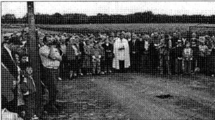
Sokan jöttek el az uborkaültetvény avatására