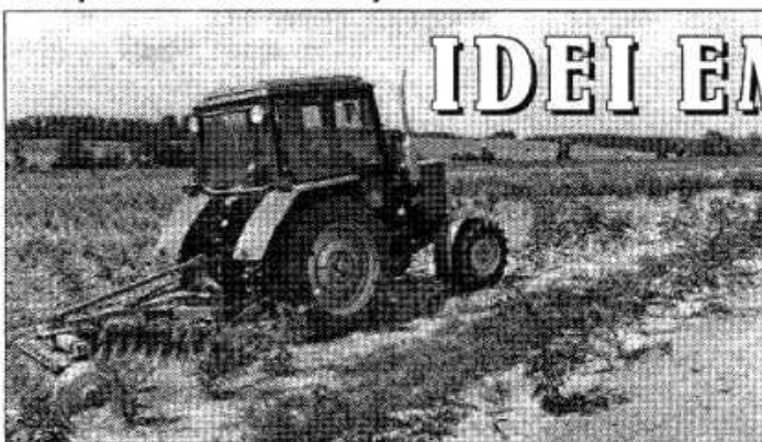
Önkormányzati erőgép műveli a talajt az erdőben